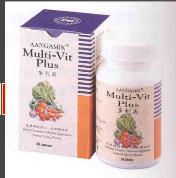
MULTI VIT PLUS